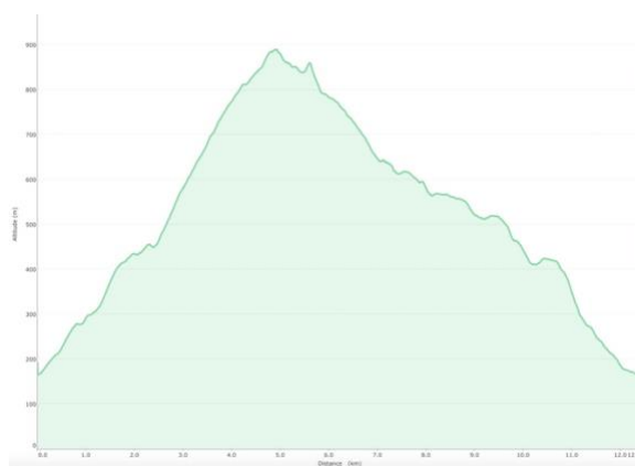
Profil altimétrique (Baigura)