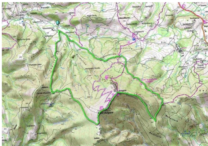
exemple de tracé (Baigura) sur Smartphone

Avec le bulletin d'inscription téléchargeable sur notre site internet ou disponible à l'association, complété, signé et accompagné du règlement.